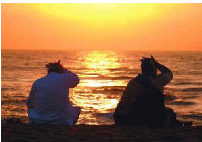
Hiran Hatan Manek 002

La técnica es tan sencilla que puede explicarse en muy pocas líneas: usted mira el Sol en una hora segura, el primer día diez segundos tan solo, y le añade cada día diez segundos. Al cabo de tres meses, coincidiendo con el final de la primera fase, usted estará mirando al Sol durante quince minutos; al cabo de seis meses, coincidiendo con el final de la segunda fase, usted estará mirando al Sol durante media hora; al cabo de nueve meses, coincidiendo con el final del proceso, usted estará mirando al Sol durante 45 minutos.